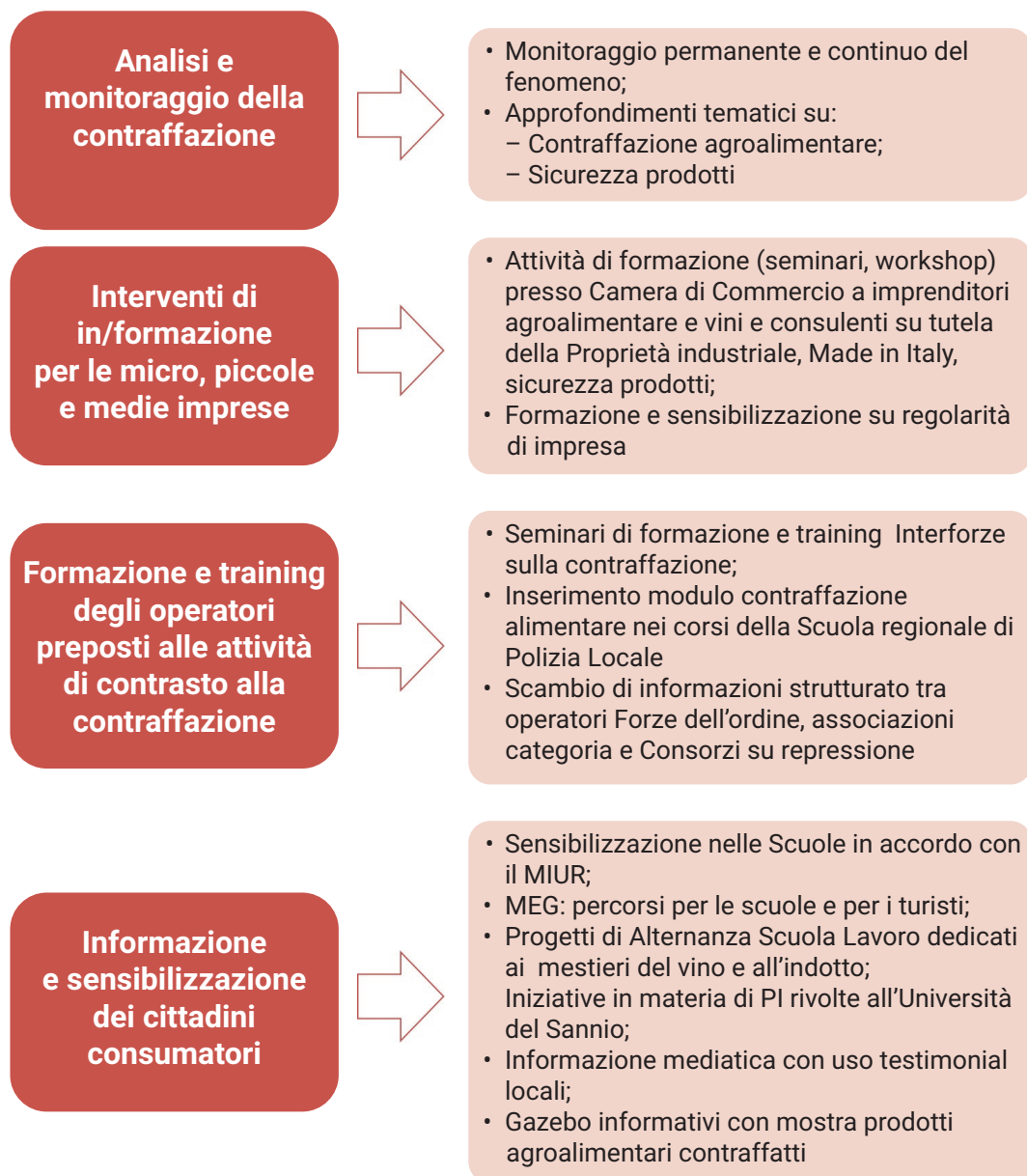
Fig. 3 - Indicazioni operative per la stesura di un futuro Piano di interventi provinciale